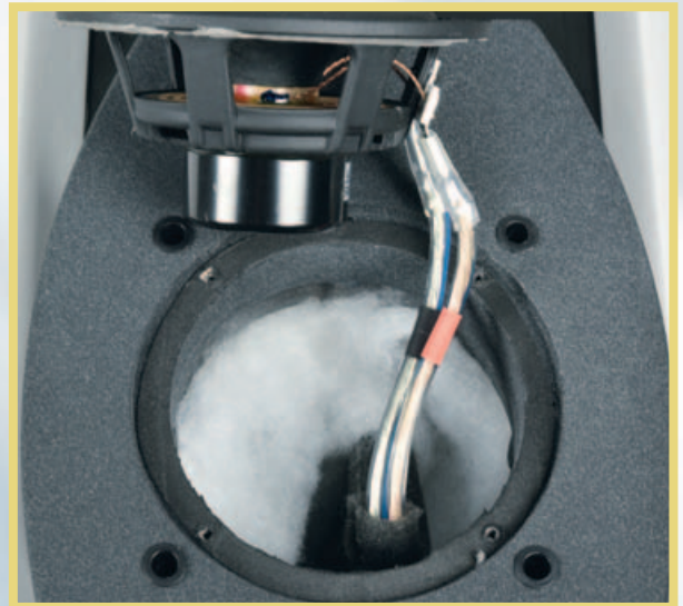
Der Papp-Breitbänder (oben) mit Neodym-Magnet spielt auf ein kleines, gut bedämpftes Volumen.