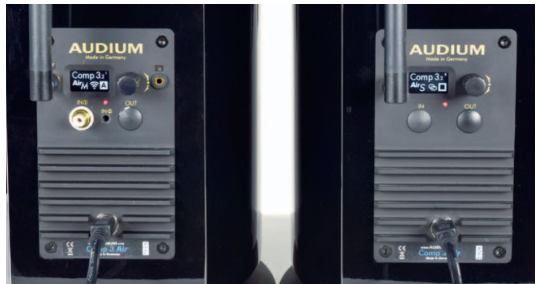
Die beiden Audium Comp 3.2 Air Wireless gleichen sich nicht wie ein Ei dem anderen: Die Master-Box (links) beinhaltet die kabelgestützten Eingänge, der Slave (darf man das noch sagen?) kann sich nur drahtlos mit dem Master verbinden.

Das galt auch für große Klangkörper: Percy Graingers „Children’s March“ auf der famosen stereoplay /Reference Recordings-CD zauberte ein riesiges Orchester nebst Chor und Klavier in den Konzertsaal. Denn vom Hörraum war akustisch überhaupt nichts mehr wahrzunehmen, die Audium spielte mit riesigem Panorama